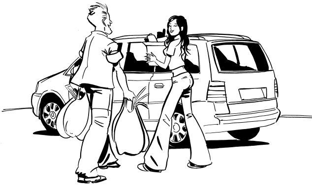
We stopped to buy some food.